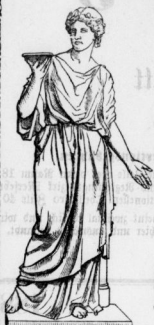
Die Gastfreundschaft von Bläser.

Buch- und Kunsthandlung, gr. Steinstrasse 63.