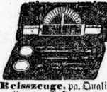
Reiszeuge von Qualität, mit guten Instrumenten, 1,50, 2 \mathcal{M} , 3, 4, 50-21 \mathcal{M}