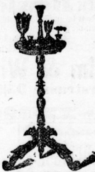
Rauchtische, großartige Auswahl, von 3-27 \mathcal{M} Schirmständer, Tischchen etc.