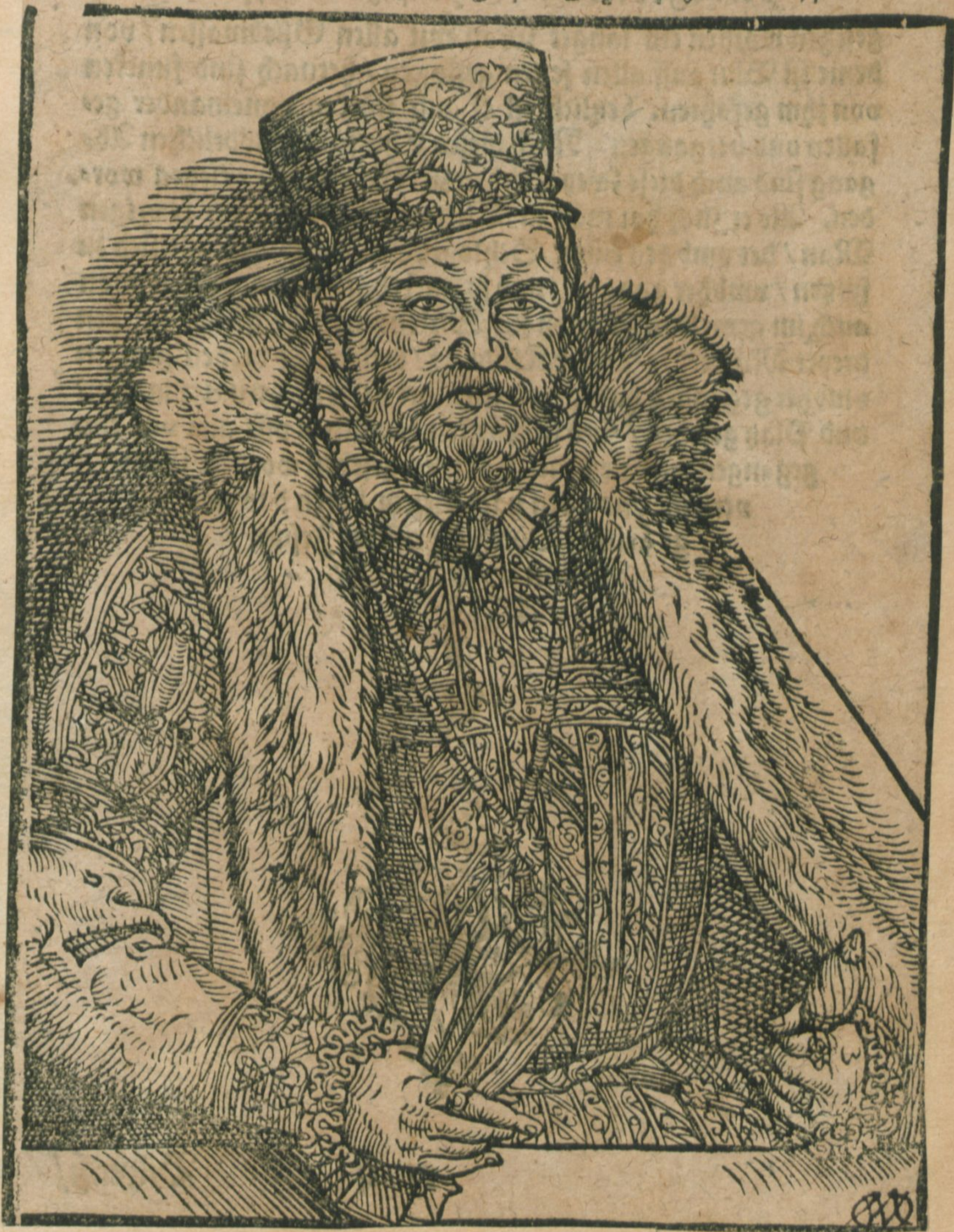
Bildniß/ Herzog Augusti/ Churf. zu Sachsen.