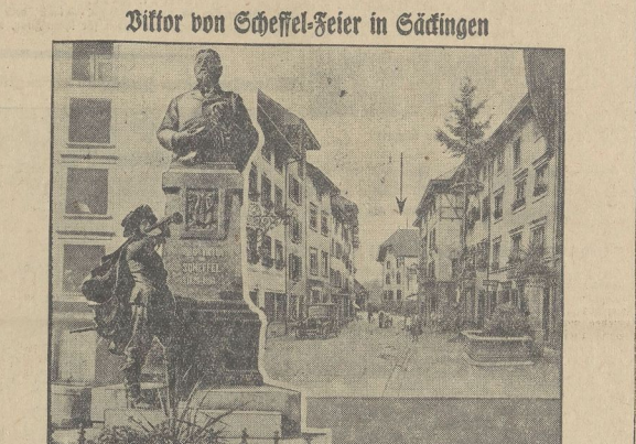
Das Dietrich von Scheffel-Denkmal in Säckingen. Das Scheffel-Denkmal (mit Pfeil) in Säckingen.

Sie haben in Europa 24 Staaten, die ihren Bestand, Land und Volk, durch ein Meer umgeben. Von ihnen soll nachfolgend ein Überblick gegeben werden. Sie sind alle in der Lage, sich für einen Krieg zu wehren, wenn sie es wollen. In der Welt sind nur noch zwei Staaten, die sich nicht wehren können, das sind die Vereinigten Staaten von Amerika und die Britischen Inseln. In der Welt sind nur noch zwei Staaten, die sich nicht wehren können, das sind die Vereinigten Staaten von Amerika und die Britischen Inseln.