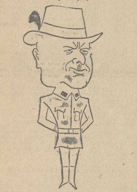
Wolfer 3 a b f.