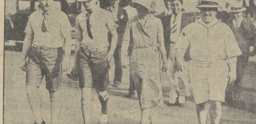
Neupfarrer in Irran Hofen, wie man sie während der Hitze vielfach in den Straßen sieht.

Beim Auftrage der Anzeigen wird für den Schriftsteller, der die Anzeigen schreiben soll, ein besonderer Preis vereinbart.