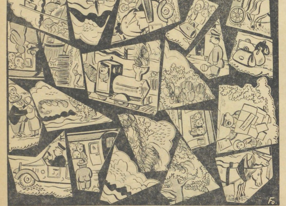
Surra, die Heisezeit ist nun gekommen. Die Kleinbahn pfeift, und ...