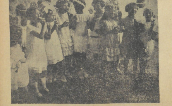
Wer sind die ...