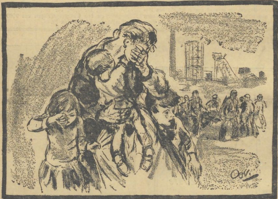
Sie waren unsere Gatten, unsere Väter, unsere Ernährer...

Die entsetzliche Bergwerkskatastrophe bei Neurode ereignet sich als die furchtbarste seit 1908. Wenn nicht unvorhergesehene Umstände eingetreten sind, muß damit gerechnet werden, daß 162 Bergleute dem Unglück zum Opfer gefallen sind. Die Rettungsarbeiten gestalten sich weiterhin außerordentlich schwierig. In der letzten Nacht ist es lediglich gelungen, die 12 Toten der Abteilung 17, die am Laufe des gefallenen Tages entdeckt hatte, an die Erdoberfläche zu bringen. Nach amtlicher Mitteilung betrug die Belegschaft des Start-Schadiges 211 Bergleute, von denen ungefähr 92 Tote geborgen sind und 70 noch als eingeschlossen gelten.