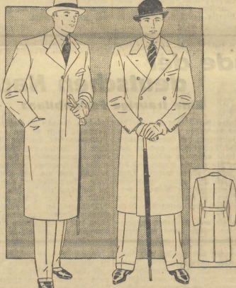
Mantel mit abfallendem Revers und bedeckter Anfrichtung aus grauem, englischen Stoff. Eingeklinkerte Taschen.

Sehr oft kommt eine Erklärung am Gehirnel von der Abspannung des einen oder anderen Teils. So wie die Dinge heute liegen, ist der Mann beinahe überarbeitet, wenn er abends nach Hause kommt. Und das macht ihn bemerkbar, weniger solange, bis er sein Essen bekommen hat. Meiner Ansicht nach gibt es keine Entschuldigungen für eine Frau, die einen Streit aufkommen läßt in der besten Zeit amischen Feiertag und "Fütterung des Raubtiers". Wenn sie schon zu gar nichts taugt — so viel Verantwortung muß sie aufbringen, daß sie ihm über diese Zeit hinweghilft. Aber ich kenne die eine oder andere liebende Gattin, die gerade diese fröhliche Stunde müßt, um dem Mann die ihre Hauslichen Wäse, Dienstbotenarbeit und Familienlager zu unterbreiten. Sie acht nicht, was sie damit ihrem hungriigen Mann für bittere Sorgen über seine Kräfte gibt, was sie ihm, ihrer Ehe — sich selbst schadet.