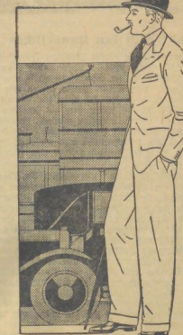
Zweireihiger Anzug auf 3 Knöpfe. Diese Form wird meist mit zweireihiger Weste getragen.