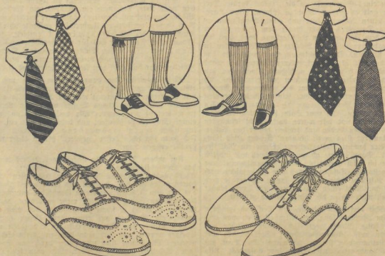
Bei der Anamnese werden Stiefeln jetzt weniger getragen, als Punkte Stiefel, keine Walker. Am meisten tragen sieht man die lange, spitze Form, wie die Rezipienten. Der steife Stiefel wird eher runder, aber nie allzu hoch getragen. Die Sportstiefel sind gefüllt und haben nur noch ganz degenie Farbtonen. Die Halbschuhe gehen überall an den Wädhern leichte Verzierung.