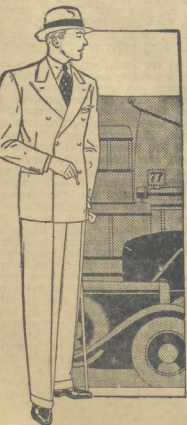
Zweireihiger Anzug aus grauem Flanell oder dunklen Stoff. Hoherer horizontaler Reversschnitt.

Wenn ein junger Mann auf der Straße einer Dame begegnet und ihr einen salomonischen Sandlun beachtet hat, so glaubt er sich höchst leicht benommen zu haben. Sicher wäre er sehr erstaunt, wenn ihm gesagt würde: Das paßt sich nicht! Im letzten Jahrzehnt wurde der Sandlun Modische — auch in Ländern und Gesellschaftskreisen, die ihn früher nicht kannten. Er kam vom Film. Er wanderte durch die Kabinellen — er gelangte auf die Straße. Und da geschah er nicht hier! Denn eines der ersten Gehege guter Lebensart heißt: Man trägt keine beachtliche Sandlun. Man trägt und denkt also durch Sandlun im Kauf, im Hotel, im Theater, überhaupt in geschlossenen