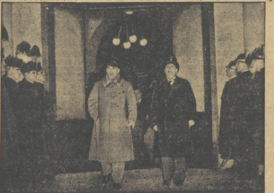
Der ungarische Ministerpräsident Gombos (links links) mit dem Reichsminister nach seiner Ankunft in Rom vom Bahnhof in die Stadt begleitet.

Italien, Österreich und Ungarn, habe Dollfuß fort, haben ja ein gleichwertiges Interesse daran, an der Donau einen Zustand herzustellen zu lassen, in dem die wirtschaftlichen Kräfte in diesem für das ganze europäische Europa so wichtigen Gebiet nicht im Kampf miteinander antreiben, sondern der Zusammenfassung dieser Kräfte in neuer entspregender Form zum Zwecke der Wiederherstellung des Wirtschaftens und der gemeinsamen Kulturarbeit ermöglicht, ein Ziel, das niemanden von der Mitarbeit ausschließen wird, weil seine Erreichung im Interesse aller liegt.