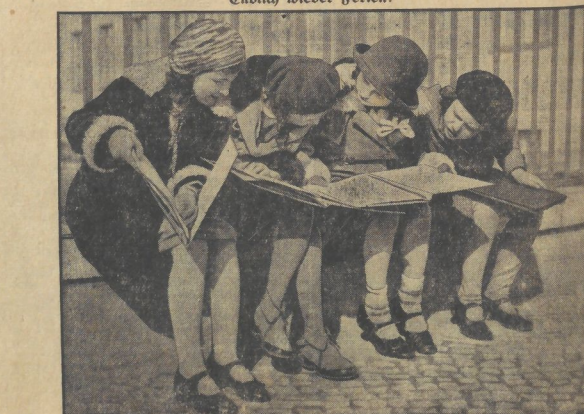
Endlich wieder Ferien! Die Jennisse werden ernst haben. Die schöne Zeit der Ferien ist der Schulfahren ist wieder gekommen. Daher wird das lebensgemessige Ferien nehmen. Wie der Zeit ins Erdbeben durch einen Meeresbeben geht, so führt der Weg in die Ferien über die Jenturen-Erdwäule.

Von E. H. Schmidt (12 Jahre), Mühl. d. H. - We. 1. Der Frühling ist da, das freuen wir uns. Es blühen heute in die Blumen so bunt. 2. Wir spielen uns Blumen zum lauten Stroh und bringen sie der Mutter mit nach Hause. 3. Die Vögel sind heimgelacht aus heiter Ferne. Wir haben sie können und lauschen so gerne.