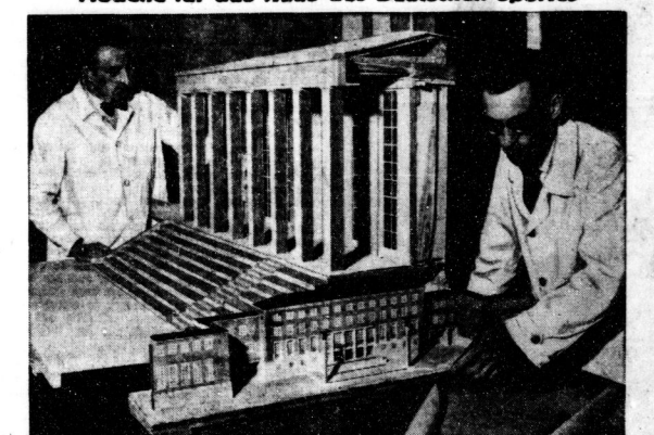
Das auf dem Gelände des Reichsportfeldes in Berlin-Grünau errichtete und bis zur Olympiade 1936 fertiggestellt werden soll. Im Vordergrund der Gebäudung, im Hintergrund die Ehrenhalle des Hauses des Deutschen Sports.