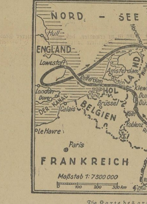
Die Karte des großen Fernfluges.

Der diplomatische Berichterstatter des „Daily Telegraph“ schreibt: