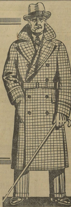
Eröffnungs-Preis für diesen Ulster mit Rundgurt