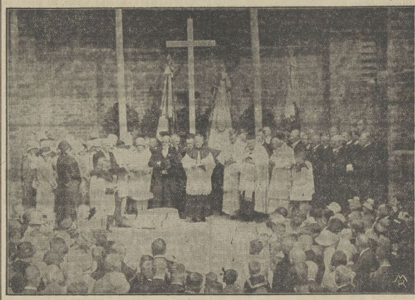
Die feierliche Grundsteinlegung der katholischen Kirche

Der Bau der Kirche wurde durch den Pfarrer ... geleitet. Der Bau der Kirche wurde durch den Pfarrer ... geleitet. Der Bau der Kirche wurde durch den Pfarrer ... geleitet.