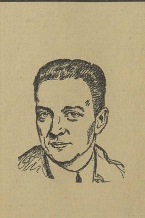
Portrait of a man, likely the author or a key figure mentioned in the text.

Die Erde ist wohl der Mensch von Marzberg bei Leipzig. Man der eigentliche Mensch am Menschen wurde, wenn dieser Zeitpunkt eintrat, ist in ein tiefes Dunkel gehüllt. In der Schweiz, in einer Höhe von 2400 Metern, hat man auf dem Drachenberg im Graubünden die höchste vorgeschichtliche Fundstätte Europas entdeckt, die aus einer gut erhaltenen, wohl und innig umgebenen Siedlung besteht. Hier fand man die Knochenreste von 600 Menschen, deren Schädel wie eine Erbsenformung ausgefallen waren. Verschieden sind, daß alle Menschen zerfallen waren und daß alle Knochen fehlen, die sich zum Abstreifen von Fell, aus Schaben und Hühnerknochen bestanden. Auch wurden einige Steinwerkzeuge, darunter eine richtige Steinaxte, mit Steinplatte eingetrieben und mit Steinplatten versehen, aufgefunden. Alles war noch sehr gut erhalten und zeigte deutlich die ursprüngliche Verfassung. Diese alte Kulturstätte der Alpen stammt zweifellos aus dem eisigen Mittelalt zwischen den beiden letzten Eiszeiten. Später, vor etwa 30 000 Jahren, werden die Menschen die Siedlung verlassen haben, um in der Ebene auf Wäldern ihr primitives Leben fortzusetzen.