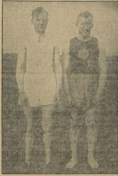
Bege (RWB Leipzig) I. Sächser (Mogeburg 96) II.

Sieger im „Mitteldeutschen Sprinterwettkampfe“ um den Wanderpreis des „Merseburger Korrespondent“.