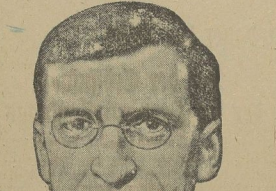
Comon de Valera.

Der Führer der irischen Republikaner, welcher in der letzten Nacht in Ulster aus dem Gefängnis entflohen war, ist in Dublin verhaftet. De Valera ist seit 1917 in der Folge der Sinn-Fein-Bewegung, welche die völlige Loslösung Irlands einschließlich Ulsters von England fordert, die Führung des irischen Freiheitskampfes (Dominion) im Jahre 1920 hat De Valera gegenüber Irland nicht verstanden, weil das britische Geisels eine Trennung von Irland und Ulster vornahm.