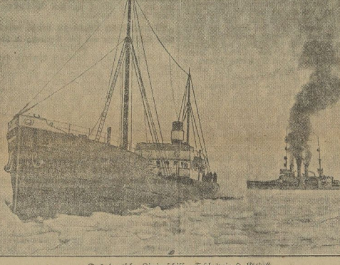
Das deutsche Linienschiff „Schleswig-Holstein“

Die deutsche Kriegsmarine hat in der letzten Zeit mehrere Schiffe der Handelsmarine gerettet. Die Schiffe sind durch die deutsche Kriegsmarine gerettet worden.