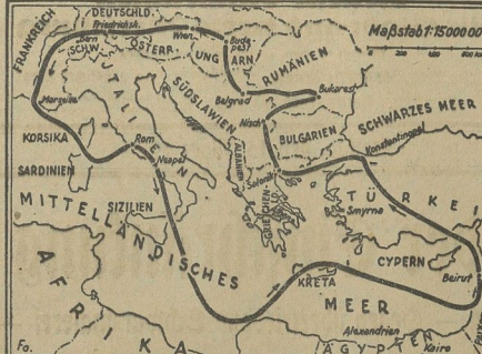
Der voraussichtliche Weg des Zeppelin-Mittelmeerfluges.

Wiederholung des Fluges im April. Am 24. März wird das deutsche Zeppelinflugzeug „Graf Zeppelin“ unter der Leitung von Graf Zeppelin zu einer weiteren Mittelmeerreise aufbrechen. Zuerst geht es nach Rom und dann nach Athen. Der Flug wird von der Reichsregierung unterstützt. Die Fahrt ist ein wichtiger Beweis für die deutsche Luftfahrt.