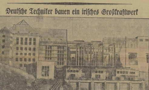
Deutsche Techniker bauen ein irisches Großkraftwerk

Der Staatsanwalt hat die Vernehmung des Motorradfahrers abgeschlossen. Die Vernehmung wurde durch die Staatsanwälte geleitet. Die Vernehmung wurde in der Hofgerichtsgebäude in Zannowitz abgehalten.