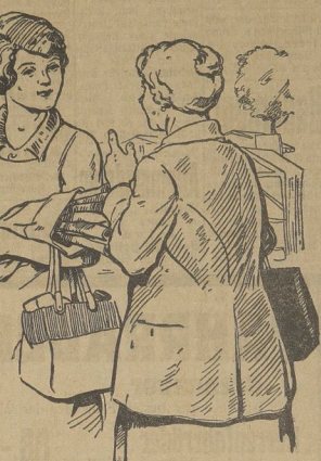
Lass Dir nicht eine beliebige Margarine auferen, sondern bestich „Blauband, frisch geküht.“ Wenn Du „Blauband“ an Stelle von Butter gebrauchst, ernährst Du Deine Familie ebenso gut und kannst bei jedem Pfund über 1 Mark in die Sparsbüchse stecken.