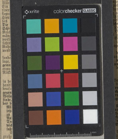
colorchecker CLASSIC xrite

Berlin, 29. Okt. (Eig. Drahtmeldung.) Die Reichstagsfraktion liegt an. Auch die Zahl. Die Reichstagsfraktion liegt an. Auch die Zahl. Die Reichstagsfraktion liegt an. Auch die Zahl.