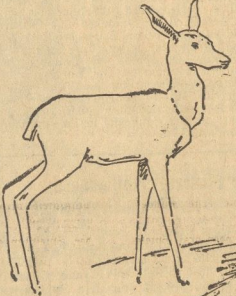
Ist es nicht niedlich?

sich als Buchstabe bewährt und bei den Rumos, die erst seit September vorigen Jahres hier sind, sind zwei ganz außergewöhn-