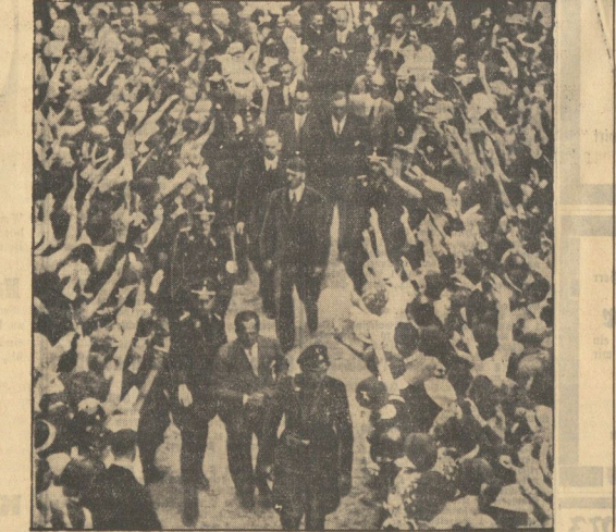
Der Kanzler bei der Eröffnungsvorstellung in Bayreuth. Adolf Hitler wird auf dem Wege zum Festspielhaus von der Menge begeistert begrüßt.

Die „Mitteldeutsche Nationalzeitung“ stellt fest, daß angeblich die Blüten Friedrichs des Großen in so hundertfacher Anzahl vorhanden seien, daß der König zeit seines Lebens fast nur Blüten gepflückt und bei jedem Spiel zu neuen 8 1/2 Pfennigen benutzt haben müßte. Gedächtnisblätter sind mehr als hundert Epinetts im Antiquitätenhandel, die angeblich von Joh. Seb. Bach eigenhändig benutzt wurden, während der Meister tatsächlich in seinem Leben nur sieben davon habe.