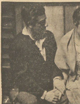
„Der Günstling“ im Stadttheater

Die ständige Tarifkommission der Reichsbahn hat in ihrer letzten Sitzung wichtige Beschlüsse gefaßt.