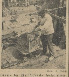
Seit Monaten stehen die Hausmannsarme der Marktkirche hinter einem dicken Hüter aus Betton. In schwindelnder Höhe werden die verschiedenen Arbeiten an der Wiederherstellung der Doppelmauer angefertigt.