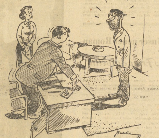
„Sagen Sie mal, was ist mit Ihnen eigentlich los? Tagelang laufen Sie hier mit dem fürchterlichen Souerkohl herum. Haben Sie was ausgesprochen? Oder wollen Sie mit dieser Maske Gehaltsverhöhung erpressen?“ — „Neel Nur'n echten Bart will ich mir bis Weihnachten wachsen lassen. Für meine Jungens geht ich als Weihnachtsmann, müssen Sie wissen!“ (Nach der neuesten Folge des im Über-Weltig erlebenden „NS-Baum“)

Wir leben vertriebenen Welten, du, Kamerad, und ich, daß wir als Wölber gelten ist unabänderlich.