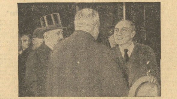
Reichsminister Delbos (rechts) kam auf seiner Rundreise durch die osteuro- päischen Staaten durch Berlin. Auf dem Bahnhoff hatte sich Reichsstaatsminister Freiherr von Neurath und der französische Botschafter in Berlin, Francois Poncel, empfangen