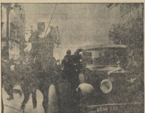
Der Augenblick der ruhmlosen Tat. Der Attentäter, der sich auf das Trittbrett des Wagens geschwungen hat, schießt in das Innere des Wagens. (Telegraphiertes Bild.)