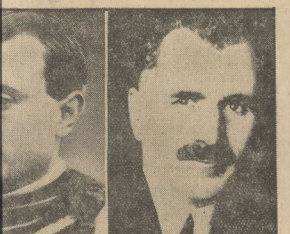
(ges.) Alexander Karageorgewitsch König von Südflawien.

Beide Exemplare dieses Aktes befinden sich in Handschriften, die durch mein Siegel verfestigt sind.