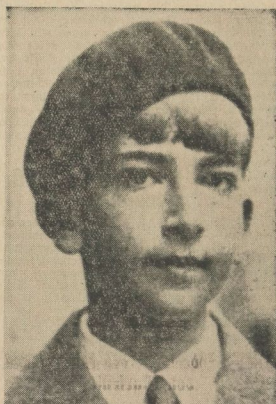
Der neue König von Jugoslawien, Peter, der in Belgrad zum König der Jugoslawen, Kroaten und Slowenen ausgerufen worden wird