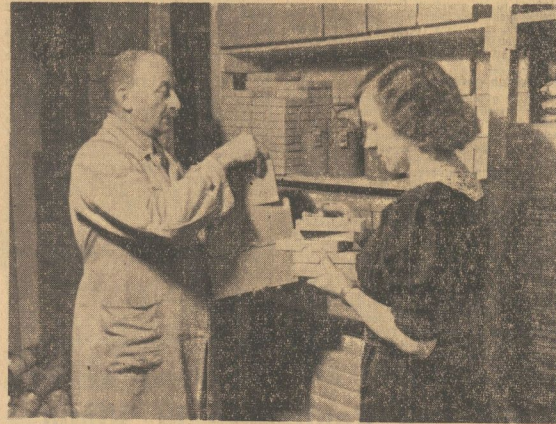
Wenn hundert KDFJ-Abzeichen in einen schmalen Karton passen, dann lassen sich auf verhältnismäßig kleinem Raum ungeheure Mengen unterbringen

Am kommenden Wochenende führt die KDFJ, ihre zweite Reichsflugtagung für das Kriegsjahr 1939 durch. In der Halle werden die Teilnehmer durch die KDFJ, ihre zweite Reichsflugtagung für das Kriegsjahr 1939 durch. In der Halle werden die Teilnehmer durch die KDFJ, ihre zweite Reichsflugtagung für das Kriegsjahr 1939 durch.