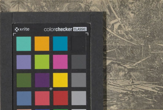
Fluß im Dschungel

Die Karte des Tages Stoßrichtung Australien Drei Flotten führen vom Indischen Ozean zum Süllen Ozean die Straße von Malakka, die Japan durch die Gewinnung der Halbinsel Malakka mit Penang und der Insel Sumatra in seine Hand gebracht hat, die Sundstraße, die nach den Kämpfen auf Sumatra und Java für Schiffe der Gegner Japans undurchfahrbar geworden ist, und die Timor-See in Verbindung mit der Torres-See. Japans Erscheinen auf der Insel Timor sowie seine nimmermehrige Landung auch auf Neu-Guinea, einerseits, seine gegen Port Darwin, Windham und Broome andererseits gerichteten Luftangriffe weisen den Weg, den Japan in unerbittlicher Konsequenz gehen wird. Singapur liegt, weil es in der von England nicht vorgesehener Weise von Land aus angegriffen wurde, so daß seine schwersten Küsten-Batterien in die Hände des Angreifers fielen, ohne einen Schuß abgefeuert zu haben. Port Darwin hingegen ist vorzugsweise gegen Angriffe von Land her geschützt, sofern man die Batterien von Emery Point und die Befestigung auf der Bahurst-Insel sowie die Wüste als ausreichenden Schutz ansehen kann.