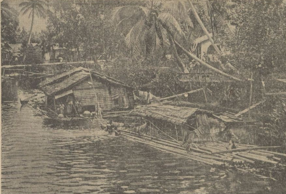
Java reizvolle Landschaft: Wohnboote auf einem Fluß im Dschungel

Port Darwin stellt einen Flottenstützpunkt zweiter Klasse dar, für aber einen Flugstützpunkt erster Klasse dar. Es verfügt heute über unterirdische Flugzeughallen, über gepanzerter Treibstofflager und eine ziemlich starke Bodenabwehr. Aber ist Australien geschützt gegen Angriffe, die der Bewinger Hongkong, Singapur, Rangun, Java weiter fortzuführen will, wenn er sich erst einmal in Port Darwin einzeln hat? Mag auch diese Frage im Augenblick noch nicht sprechbar sein, so reicht es aus, festzustellen, daß Japan seine Absichten, auf dem australischen Festland festen Fuß zu fassen, durch sein Vorgehen gegen Timor und Neu-Guinea eindeutig hat durchsickern lassen.