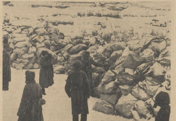
Aufgestapelte Postsäcke warten auf das Eintreffen der Fahrzeuge der einzelnen Divisionspostämter. Pz.Abt. 1. Artillerie-Regiment 844 (83).

Den Gardejägern. Schon habe ich ihm, Erzählung, zulage geschickt, aber er hat nicht bekommen. Ich bitte um Ersatz, fertigen Sie die Briefe doch einmal! Es ist um die Schwere von Kriegen, wenn man den Kindern, die fürs Vaterland freit, was folgt, und sie nicht bekommen.