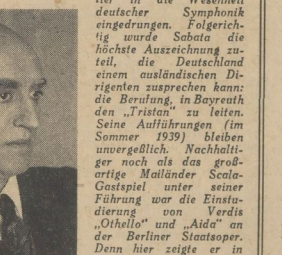
Italiens größter Dirigent. Toscanini. Er hat in Berlin Symphonien von Mozart, Beethoven und Brahms dirigiert. Er eroberte dabei den südlichen Plastik des Klungs und den Operndramatiker.