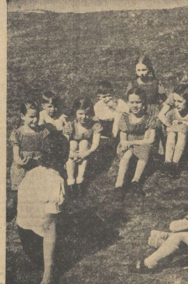
Bild: 2003-Bildbeschrift (Frauenstille) Die Kindergruppe ist „ausmarschiert“