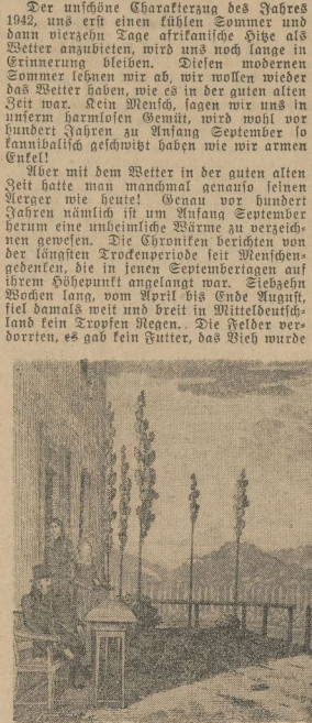
Für durstige Seelen war die Bergschenke schon immer ein lohnendes Ziel

Am 21. der 41. Zuteilungsperiode vom 21. September bis 18. Oktober werden an Brot, Mehl, Fett, Butter, Margarine, Käse (abgelaufen) und Kartoffeln eine Zuteilungsperiode erfolgen (Sonderzuteilung), Quark, Getreideerzeugnisse, Eiern, Margarine, Kartoffelkuchen, Nudeln, Zucker, Marmelade, Konserven und Kaffeeersatz. Die gleichen Normen ausgeben wie in der 40. Zuteilungsperiode. Gefürzt wird lediglich die Zuteilung an Kaffee-Ertrag, die künftig mit 200 g aus 20 g Kaffee als Ersatz für die gleiche Menge an Kaffeeersatz zu werden. Die Fleischzuteilung wird ebenfalls in der gleichen Weise ausgegeben wie in der 40. Zuteilungsperiode. Gefürzt wird lediglich die Zuteilung an Kaffee-Ertrag, die künftig mit 200 g aus 20 g Kaffee als Ersatz für die gleiche Menge an Kaffeeersatz zu werden.