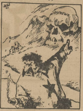
Zeichnung: Oberst. Heise