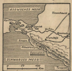
Schwarzmeer-Hafen Gelendzhik angegriffen