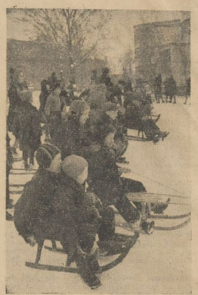
„Garmisch“ an der Ortskrankenkasse