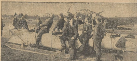
Zusammen mit italienischen Kameraden beobachten die deutschen Flieger den Flug einer ankommenden Staffel