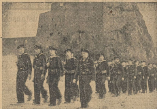
Blau Jungen marschieren bei Niedrigwasser über das Watt zur alten Festung, dem 'Casin' der Insel Jersey