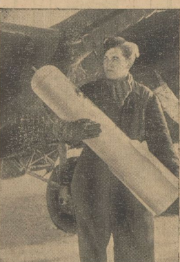
Ein wichtiges Hilfsmittel unserer Luftwaffe sind die Leuchtbomben, die hier zu einem Kampfflugzeug gebracht werden