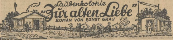
„Läubenkolonie für alten Liebe“ ROMAN VON ERNST GRAU