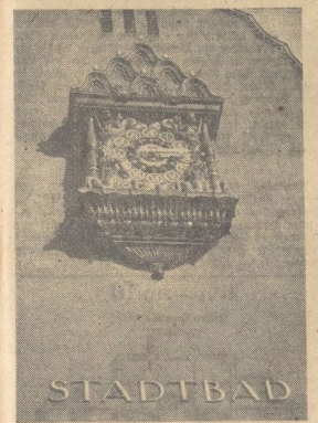
Die elektrische Uhr am Stadtbau, die schon manchem verunglückte Stunden verlor, wenn er durch das Tor unter ihr ging