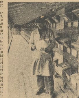
Bei den beneideten Tieren, die von Berufs wegen ein dickes Fell haben