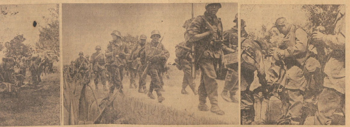
Links und rechts: Luftlandtruppen und Fallschirmjäger kurz nach der Landung auf Kreta. — Bild Mitte: Nach der Landung auf Kreta setzen sich die gelandeten Gebirgsjäger sofort gegen die feindlichen Stellungen in Marsch.