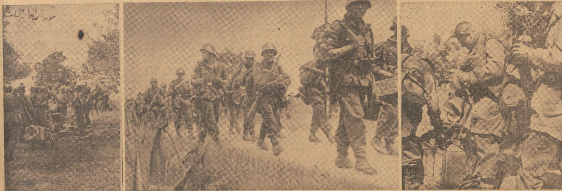
Bild links und rechts: Luftlandtruppen und Fallschirmjäger kurz nach der Landung auf Kreta. — Bild Mitte: Nach der Landung auf Kreta setzen sich die gelandeten Gebirgs- jäger sofort gegen die feindlichen Stellungen in Marsch

Es lebe der Führer! ges. Göring! Reichsmarschall des Großdeutschen Reiches und Oberbefehlshaber der Luftwaffe.