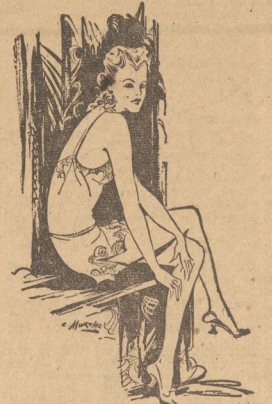
... am besten, ich verzichte auf das Gold meines Lords und schaffe mir einen Lebensmittelhändler an! Bildung: Bertha

... als sie vier Tage und drei Nächte in einem kleinen Schlauchboot zu dreihundert einhundertfünfzig Kilometern weit im Nordmeer schwammen, dazu noch mit einem verunfallten Kameraden. Es ist dies ein Fall, der in bezug auf die Umstände und Dauer einmalig ist und bisher auch nicht für möglich gehalten wurde. Welche unerhörte Tapferkeit und welchen Lebenswillen haben diese Soldaten doch bewiesen, nach dem schrecklichen Erleben zu versuchen, mit einem kleinen Handboot, das für untauglich gehalten wurde, die unsichtbare Küste zu erreichen. Sie haben die Strecke teils mit einem Notsegel, das aus Bädern und Oberdecken hergestellt wurde, zurückgelegt und wurden erst 300 Meter von der Küste von einem normwegischen Fischerboot von ihren Leiden befreit. Keiner der Kameraden hat irgendwelche ernsthaften Schäden zurückbehalten, nur ihre Gesichter und Hände sind von Sonne und Meerwasser aufgerissen und zeigen Spuren des Kampfes. Stolz empfinden sie das Eisener Kreuz, das ihnen in Tallen für bewiesene Tapferkeit vor dem Feind.