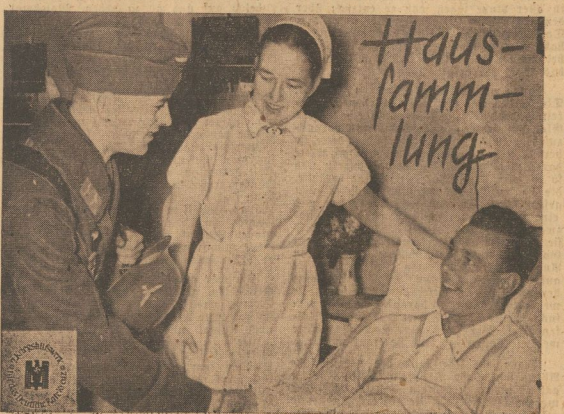
Für das 2. Kriegshilfswerk des Deutschen Roten Kreuzes am 13. Juli 1941

Seit dem 1. August 1940 erhalten die Besitzer von Gebrauchshunden Futtermittelschneide, die je Hund zum Besatz von monatlich bis zu 6 Kilogramm pflanzlichen Futtermitteln berechneten. Da diese Schneide am 31. Juli 1941 ihre Gültigkeit verlieren, ist nunmehr in einem neuen Erlass des Reichsernährungsministers die Ausgabe neuer Futtermittelschneide geregelt worden. Die Vorschriften hierüber unverändert. Futtermittelschneide werden danach nur für Hundehunde der Polizei, Wehrmacht, Gendarmerie und Partei, für Hundehunde, Rassehunde, Hunde, die in Jagdgruppen gehalten werden, Jagdgebrauchshunde, Hunde, die in Tierheimen gehalten werden, für Hundehunde schwerer Arbeiter und tauber Personen, sowie für Rasse- und Hundehunde. Wichtigste Betriebe ausserdem, also für Gebrauchshunde im weitesten Sinne des Wortes. Die Besitzer anderer Hunde verzichten sich wie bisher durch die zoologischen Fachgeschäfte mit pflanzlichen Futtermitteln. Sie müssen sich in die Kundenliste einer zoologischen Handlung eintragen lassen und dabei die Steuernummer bzw. Marke ihres Hundes vorlegen.