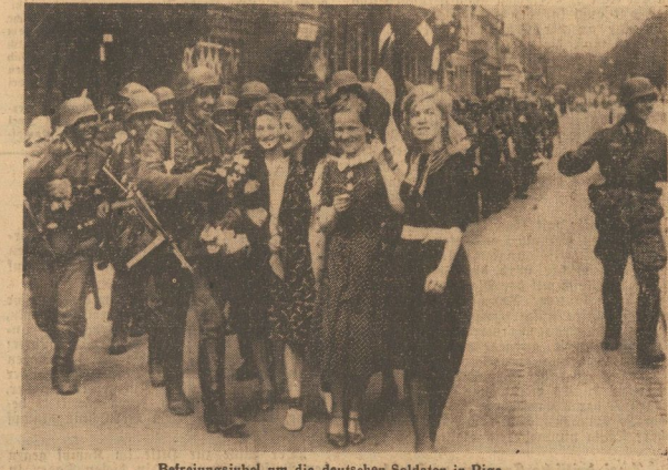
Belegungsfeier der deutschen Soldaten in Riga. Als die deutschen Truppen die Stadt Riga einnahmen, wurde die dortige Bevölkerung von einem Jubelsturm der Freude erfasst.

Sowjetpanzer lagen vernichtet Im Rahmen von Dubno vernichtete eine Panzerabteilung eine Gruppe von sowjetischen Panzerwagen. Die Panzerwagen waren über 40, darunter eine Anzahl von Panzern. Eine andere Division vernichtete ebenfalls eine Gruppe von Panzern. Die Panzerwagen waren über 40, darunter eine Anzahl von Panzern.