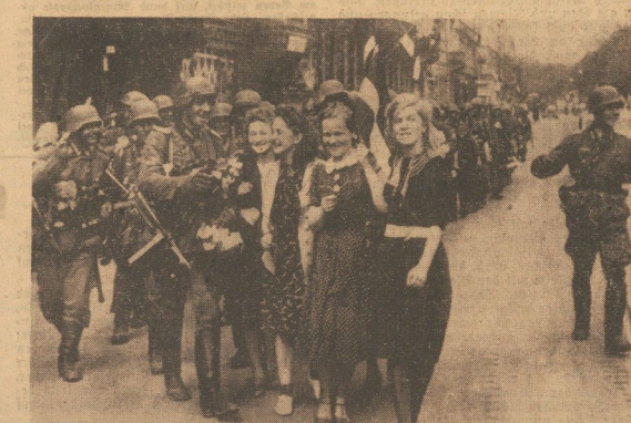
Befreiungsjubiläum der deutschen Soldaten in Riga. Als die deutschen Truppen die Stadt Riga einnahmen, wurde die dortige Bevölkerung von einem Jubelsturm der Freude erfaßt.

Berlin, 7. Juli. Den vorstehenden deutschen Wehrmachtberichten sind in den letzten Tagen in den Ostfronten neue Beweise für die Angriffsabsichten der Sowjets gefunden worden. Die Karten zeigen, dass die Sowjets in den letzten Wochen und Monaten in sowjetischen Stützpunkten hergestellt wurden. Die Karten zeigen, dass die Sowjets in den letzten Wochen und Monaten in sowjetischen Stützpunkten hergestellt wurden. Die Karten zeigen, dass die Sowjets in den letzten Wochen und Monaten in sowjetischen Stützpunkten hergestellt wurden.