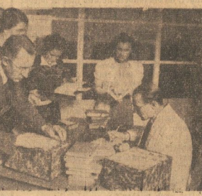
Lebhaft ist die Nachfrage am Ausgabebeste