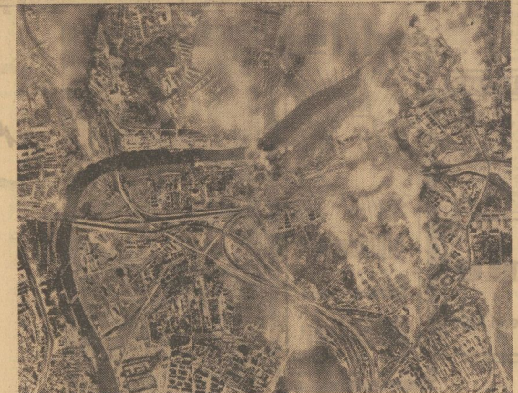
Erster Bildbericht von den Bombenangriffen auf Moskau Wie unsere Aufnahme zeigt, liegen noch am Tage nach den Angriffen deutscher Kampflugzeuge riesige Brandwolken über den Fabriken in einem Moskauer Stadtteil