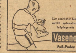
Zum sportlichen Siegesverhüllnis systemische Fußpflege mit Vaselen Fuß-Puder