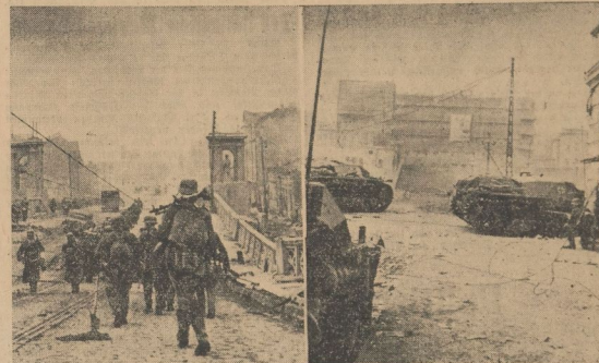
BR-Aufnahme: Kriegsbeteiligter Soldat (28) und Kriegsbeteiligter Heinz (28) Charkow in deutscher Hand Jeder Widerstand in den Vororten der großen Industriestadt Charkow ist vom Schwung der deutschen Truppen gebrochen worden. Unsere siegreichen Truppen ziehen in die Stadt ein

Frontlinien gelegenen Räumen unterbanden die eigenen Flugzeuge durch Bombenabwürfe an vielen Stellen den Nachschub der Sowjets. 20 Panzer, 12 Panzer, 4 Geschütze, 10 Schützenpanzer wurden zerstört. Zwei Batterien der Sowjets, die einen wichtigen Abschnitt beherrschten, wurden zum Schweigen gebracht. Bei Angriffen auf das sowjetische Eisenbahnhauptquartier wurden sieben Kompanien unterbrochen, zwei Panzer und acht Lokomotiven zerstört. 29 Panzer beschädigt, davon zwölf zum Teil in Brand geschlagen. In der Nacht zum 29. Oktober wurden die Moskauer Kremlanlagen durch Bombenangriffe schwer getroffen. In der Nacht zum 29. Oktober wurden die Moskauer Kremlanlagen durch Bombenangriffe schwer getroffen.