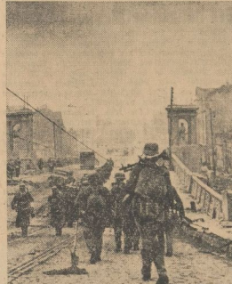
Jeder Widerstand in den Vororten der großen Industriestadt Charkow ist vom Schwung der deutschen Truppen gebrochen worden. Unsere siegreichen Truppen ziehen in die Stadt ein.

Frontlinien gelegenen Stämmen unterbanden deutsche Flugzeuge durch Bombendurchwürfe an vielen Stellen den Nachschub der Sowjets. 22 Panzer, 12 Panzer, 4 Geschütze, 10 Schützenpanzer wurden zerstört. Zwei Batterien der Sowjets, die einen wichtigen Abschnitt beherrschten, wurden zum Schmelzen gebracht. Bei Angriffen auf das sowjetische Eisenbahnen wurden sieben Dampflokomotiven zerstört, zwei Güter- und acht Lokomotiven zerstört, 29 Güter beschädigt, davon zwölf zum Teil in Brand geschossen, 10 bis mit ihrer Besatzung an beiden Enden des Bahnhofs wurden zerstört, Güter- und Vorratstruppen wurden einbezogen oder in Brand gesetzt. Eine wichtige Eisenbahnbrücke wurde durch Bombendurchwürfe zum Einsturz gebracht worden.