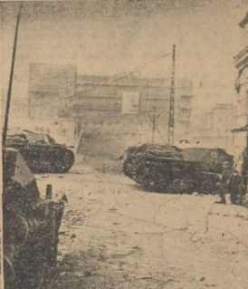
Jeder Widerstand in den Vororten der großen Industriestadt Charkow ist vom Schwung der deutschen Truppen gebrochen worden. Unsere siegreichen Truppen ziehen in die Stadt ein.