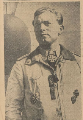
BR-Aufnahme: Kriegsbeteiligter General (28) Zum 100. Luftsturz des Majors Oesau Neueste Aufnahme des Kommandore eines Jagdgeschwaders, Major Oesau, der am 28. Oktober seinen 100. Luftsturz errungen hat

liche Jagdflieger, der hundert Aufstiege erlangt hat. Jetzt hat er wieder im Kreise seiner Kameraden, mit denen er schon nach hundert Kampf gemeinsam geflogen hat. Er fliegt die kleinen Jagden hin, um die Mitte des Kanals hoch hinaus, auf einmal die englischen Jäger unter sich geflogen hatte. Ganz ruhig und überlegt war er beim Abschießen. Nur ein ganz klein wenig größer schaute, auf den der Kommandore da losgegangen war. Ohne sich auch nur eine Sekunde abzuheben, hatte er angegriffen und sich von oben hinter eine Spitzreife geflüchtet. Nur ein ganz klein wenig größer schaute, auf den der Kommandore da losgegangen war. Ohne sich auch nur eine Sekunde abzuheben, hatte er angegriffen und sich von oben hinter eine Spitzreife geflüchtet.