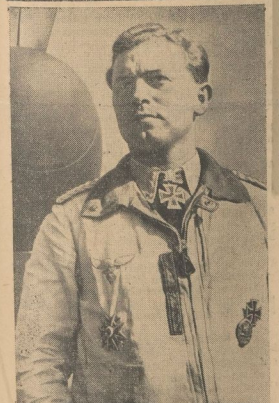
Neueste Aufnahme des Kommandeurs eines Panzerabteiles, Major Desaus, der am 28. Oktober seinen 100. Luitestieg errungen hat.

... 28. Okt. (PK) Am Morgen veränderten wieder einmal sowjetische Panzerverbände über der Kanal nach der nordfranzösischen Küste einzufliegen. Aber dort bes sofortigen Einarsens der deutschen Panzer wurde der Angriff mit bedenklichen Verstritten für die Reihe abgeschlagen. Der Major Desaus der bereit ist mit dem Mitteltrupp mit Eisenlauf und Schwerten aus-gesetzte Kommande eines Panzerabteils, schon dabei seinen hundertsten Gegner ab. Major Desaus ist damit der dritte deut-