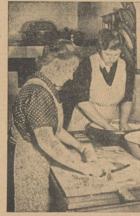
Links: Beim Kuchenbacken. - Rechts: Beim Gänsefüttern

Ich will einmal Wirtschaftlerin werden! antwortete ein fröhliches Mädchen auf unsere Frage nach ihren Wünschen an die Zukunft.