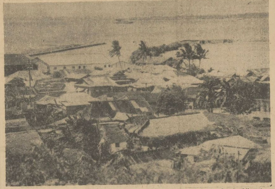
Teilansicht des amerikanischen Stützpunktes Guam, eines etwa 540 Quadratkilometer großen Korallenalelands, das von den Japanern besetzt wurde.