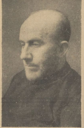
Der Großmuller, der als Ehrengast der deutschen Reichsregierung an der Reichstagsitzung teilnahm