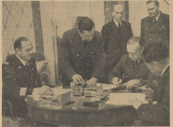
Die Unterzeichnung des Abkommens über die gemeinsame Kriegführung Der Reichsminister des Auswärtigen von Ribbentrop mit dem italienischen Botschafter Alfieri und dem japanischen Botschafter Oshima bei der Unterzeichnung des Abkommens über die gemeinsame Kriegführung Deutschlands, Italiens und Japans am 11. Dezember im Auswärtigen Amt

Was die übrigen Länder anbelange, so nehme Niederländisch-Indien bereits durch die Entsendung von Fliegern nach Sinauap an den Kriegsbahnen teil, während die Stellung Australiens durch Verführung der USA-Wälen von Suwai und den Philippinen eine bemerkenswerte Veränderung erfahren habe. Der Verlust der Philippinen in der Verbindung mit Sinauap bilden sollte, bestehe nicht mehr eine ursprüngliche Verbindung mit der indonesischen Kontrakte der Straße um der Verlust der USA-Wälen im Pazifik bedeuten in jedem Fall die Abberaumung Lieferungsverbindungen von allen Lieferungen.