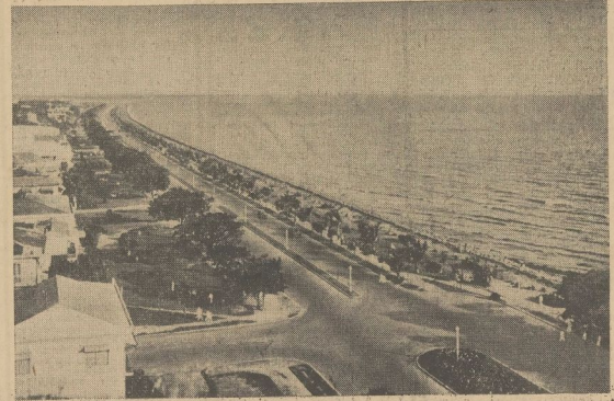
Teillück auf die Bucht von Manila, der Hauptstadt der Philippinen. Japanische Flugzeuge warfen wiederholt ihre Bomben erfolgreich auf den Hafen.