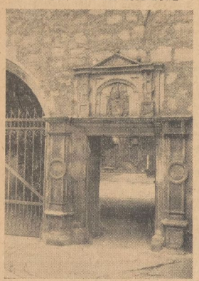
Wahl: 1943: Halles (Gaul)