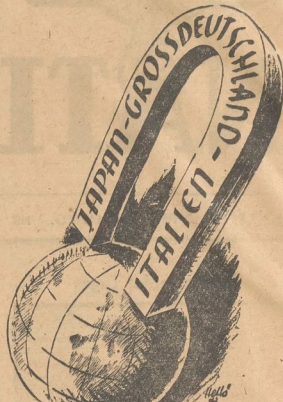
Befehlsmag. Symbol der anziehenden Kraft, Symbol des Glücks