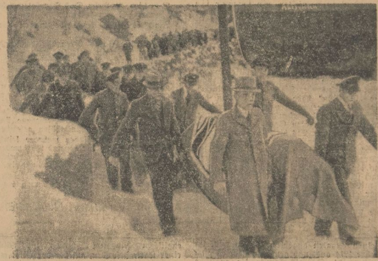
Bildtelegramm aus Oslo. Die Opfer des hinterhältigen britischen Piratenüberfalls auf das deutsche Schiff „Altmark“ in der Fjord wurden in norwegischer Erde feierlich beigesetzt. Unser Bild: Die Ueberführung der Opfer von der „Altmark“ (im Hintergrund) nach dem Dorffriedhof von Sogndal.

italen Schiffen, die in der vergangenen Woche sanken, befinden sich auch zwei Schiffe, deren Untergang bis jetzt nicht gemeldet worden war und zwar ein holländisches und ein norwegisches Schiff. Bei dem holländischen Schiff handelte es sich um den Dampfer „Hilfer“ (6672 BRT), der infolge einer Explosion unterging. Die ganze Besatzung wurde gerettet. Das norwegische Schiff hatte den Namen „Zoua“ (4297 BRT), 28 Mann der Besatzung und ein Besatzungsmitglied wurden getötet.