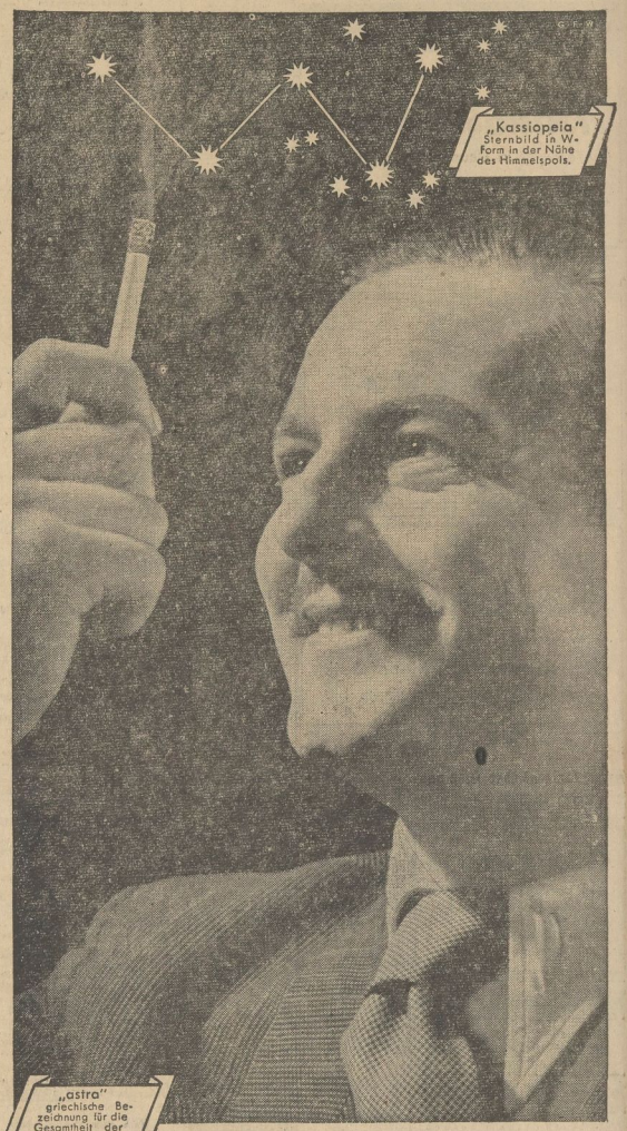
"Kassiopeia" Sternbild in W. Form in der Höhe des Himmelspols.