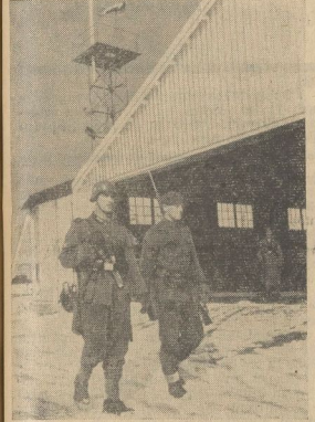
Kampfbereite Besetzung eines norwegischen Flughafens. Ein deutscher und ein norwegischer Soldat sind gemeinsam auf Posten gezogen

Außerdem haben die Behörden in ihrer Not dem Schwarzhandel den Kampf angefangen. Nicht weniger als 1700 Beamte des Ernährungsministeriums sollen die Geschäfte überwachen, die immer noch gegen höhere Bezahlung rationierte Lebensmittel ohne Bezugsschein an die pluriaktiven Kreise abgeben.