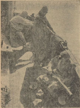
Schießen Churchills Fischer mit dem MG. nach den Fischen? So sehen die harmlosen englischen Fischer auf ihren Vorpostenbooten aus! Sie haben ihr MG. an Bord und den strikten Auftrag von Churchill, jeden Deutschen, wo er sich auch zeigt, zu erschießen.