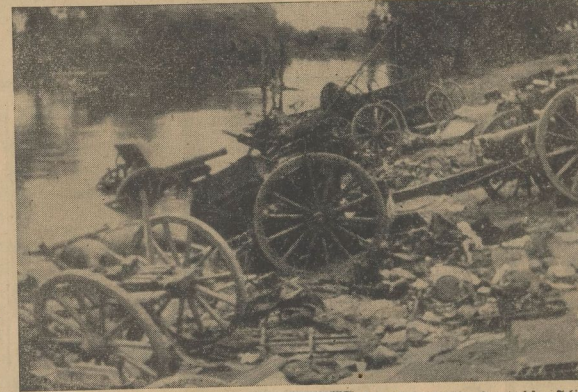
„Mit Mann und Roß und Wagen, hat sie der Herr geschlagen.“ Eine Aufnahme aus dem Film „Feuertaufe“