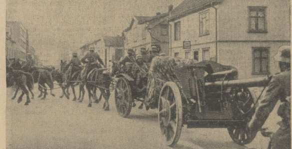
Die Besetzung des norwegischen Gebiets macht täglich neue große Fortschritte. Nunmehr sind auch sämtliche Eisenbahnstrecken nach Schweden besetzt worden. Unser Bild zeigt deutsche Artillerie auf dem Marsch durch Norwegen

Das in Kampf mit ihm der Seemann steht, das ist ein Gefecht unter gleichen Voraussetzungen, mit gleichen Waffen. Die deutschen Zerstörer haben den ersten Kampf angenommen und zu Ende geführt, zum bitteren Ende der englischen Kräfte.