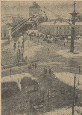
Min.: RR-RG-Sange-Zehrt Die Reichskriegsflagge über einer norwegischen Stadt Die Reichskriegsflagge weht über dem Platz einer norwegischen Stadt, in deren Straßen das Leben seinen gewohnten Gang nimmt