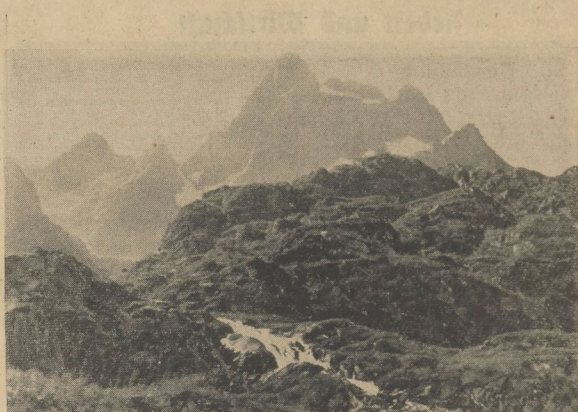
Das Operationsgebiet im hohen Norden. So sieht das Gelände aus den Luftorten und dem von deutschen Truppen besetzten Raum von Narvik aus. Man sieht den Wasserfall im Trolldjord. Im Hintergrund der 1045 Meter hohe Trollindrer