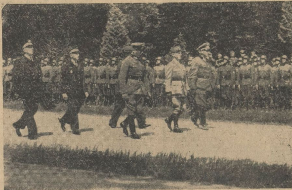
Die Ankunft der französischen Abordnung

Wir stehen am Rande der Station, auf der — nachdem der Führer gestern abgefahren war — nunmehr der Wagen allein wieder Mittelpunkt des Interesses geworden ist. Wir alle, die die Unterzeichnung hier erwarten, steht eines fest: Diese Tage dürften wohl kaum übertroffen werden können. Die kurze feierliche Handlung am gestrigen Nachmittag hat gerade durch die folgerichtige und laudable Form, in der der Führer sie vollzog, uns alle tief ergreifen. Immer wieder erzählt man sich gegenseitig aus den Berichten jener Novembertage, wie anders es damals zuging. Es ist unmöglich, irgendwelche Vergleichs- oder Parallelen ziehen zu wollen. Denn das Deutschland, das heute hier in Compiègne steht, ist mit dem, das 1918 seinen Zusammenbruch an dieser Stelle erleben mußte, nicht zu vergleichen. Besonders die deutschen Soldaten, die 1918 hier vorbeigekommen sind, wo die deutsche schwere Eisenbahnartillerie aus dem Balde von Compiègne Paris beschloß, sind vom Erlebnis dieser Tage tief ergreifen.