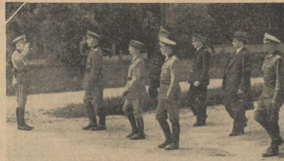
Dritter von links der französische General Huntzinger. Hinter ihm (etwas im Hintergrund) der französische Konteradmiral Le Luc, hinter diesem der General der französischen Luftwaffe Bergeret und dann der französische Botschafter Noel