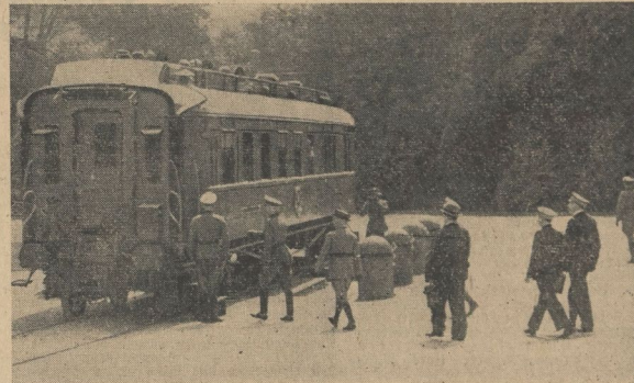
Der Wagen des Marschalls Foch im Wald von Compiègne, in der die Uebergabe der Waffenstillstandsbedingungen erfolgte. Eben begeben sich die französischen Unterhändler, General Huntzinger an der Spitze, in den Wagen