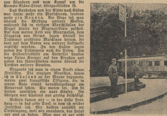
Die Standarte des Führers über dem Schandstein von Compiègne