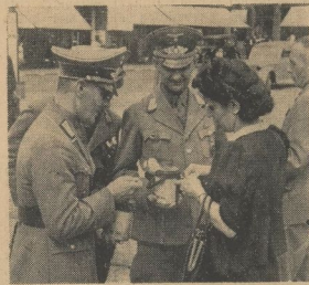
Jeder gab, auch mehrmals, wenn die Frontbecken des Weltkrieges mit der roten Büchlein klapperten