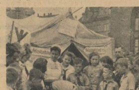
Feldscher der HJ. zeigen ihr Können in Verbinden

Heimat den Schweden des Krieges fernhielten. Zahl Großes gab es 50-Pf.-Eckchen und Markstücke.