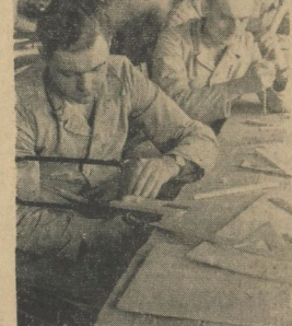
Laubsagen ist eine Kunst, die jeder Verwundete aus seinen Knabenjahren kennt

Unter den Verwundeten finden sich gewigte Geister, die nur einen Blick auf die Vorlage zu werfen brauchen, um dann in flinken Strichen durchaus originelle Entwürfe zu schaffen.