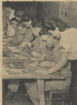
Unter sachkundiger Anleitung ersehen aus Pappe die schönsten Geschenke

Wir müssen es alle: Wenn man nicht mehr sehr krank und doch noch nicht ganz gesund ist, wird die Zeit im Krankenhaus oder zu Hause sehr lang.