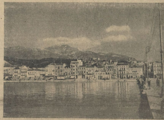
Der griechische Hafen von Patras, der erneut von der italienischen Luftwaffe bombardiert worden ist.

Die italienische Luftwaffe hält die griechischen Luftstationen unter ständiger Kontrolle, und zwar in erster Linie die Luftstationen von Patras und Saloniki. „Corriere della Sera“ gibt als wichtiges Ziel die Eisenbahnlinien Saloniki-Athen und Korinth-Patras-Tripolis-Korinth an.